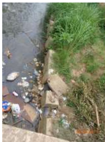
Foto 6. Acumulo de resíduos sólidos nas ancoragens