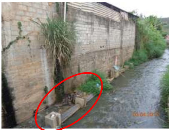
Foto 13. Locais de aprisionamento de fluxo, gerando eutrofização e maus odores