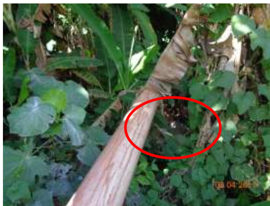
Foto 14. Lançamento de esgoto no fundo de residência