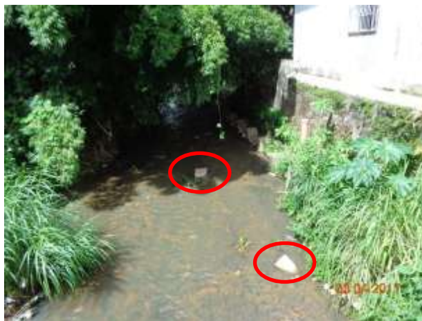
Foto 2. Ancoragens soltas