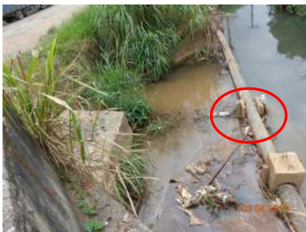
Foto 3. Ancoragens quebradas