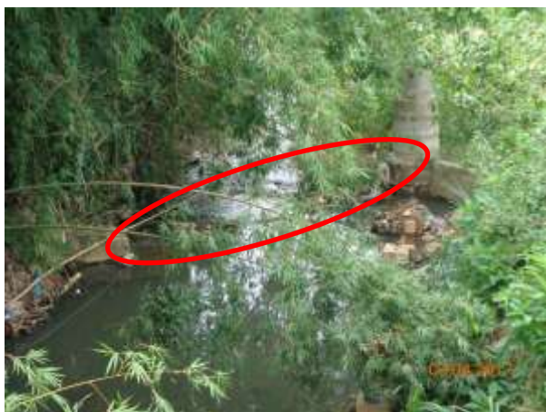
Foto 5. Remanso provocado por travessia do interceptor