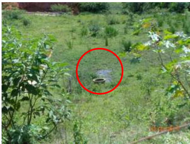
Foto 15. Lançamento em solo