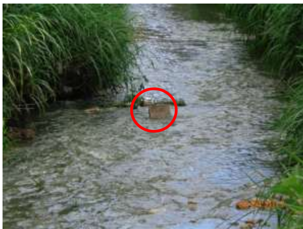
Foto 1. Ancoragens soltas