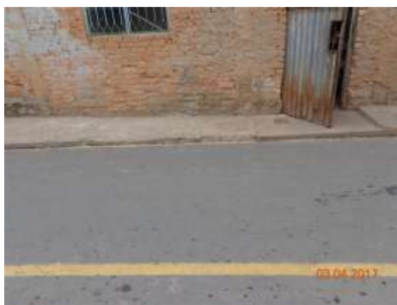
Foto 8. Local onde houve denúncias de usuários de casos de inundações que provocaram refluxo de