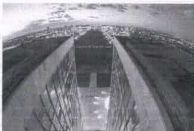
Vieta aérea da Esplanada dos Ministérios, em Brasília

São Paulo – Em um momento de cortes de gastos, o Ministério do Planejamento divulgou nesta quinta-feira uma lista de 239 imóveis pertencentes à União que estão à venda. As propriedades estão localizadas em 21 estados e no Distrito Federal.